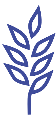
Zielony dziki owies Avena sativa