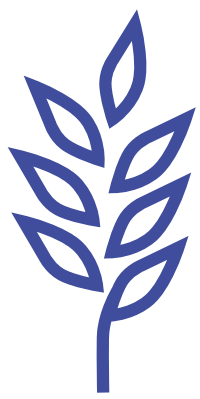
Avena verde silvestre Avena sativa