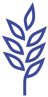
Avena verde silvestre Avena sativa