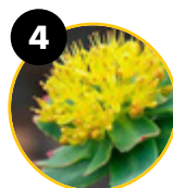
4 Różeniec górski ( Rhodiola rosea )