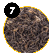
7 Zielona herbata ( Camellia sinensis )

Żelazo to jeden z minerałów przyczyniających się do prawidłowego metabolizmu energii.