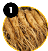
1 Eleuterokok kolczasty ( Eleutherococcus senticosus )

Ciało Regeneracja organizmu 1 Zmęczenie i wyczerpanie fizyczne 1,5,6 Metabolizm tłuszczów 2,6 Metabolizm glukozy **5 Wydolność fizyczna 3 Witalność 3,5 Wytrzymałość 3,4,5