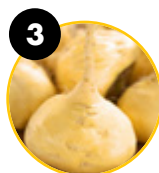
3 Pieprzycza peruwiańska ( Lepidium meyenii )