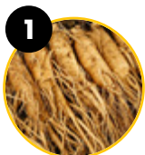
1 Sibiriniai ženšeniai ( Eleutherococcus senticosus )

atsigavimas 1 Nuovargis – fizinis nuovargis 1;5;6 Riebalų apykaita 2;6 Gliukozės apykaita **5 Fiziniai gebėjimai 3 Gyvybingumas 3;5 Ištvėrmė 3;4;5