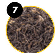
7 Žalioji arbata ( Camellia sinensis )

Geležis yra vienas iš mineralų, prisidedančių prie įprastinio energijos metabolizmo. Gliukozė – svarbus energijos šaltinis daugumai kūno ląstelių, įskaitant smegenų ląsteles.