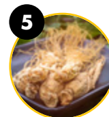
5 Korėjiniai ženšeniai ( Panax ginseng )