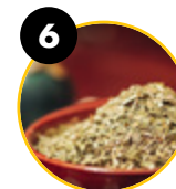
6 Paragvajiniai bugieniai ( Ilex paraguariensis A. St.-Hil)