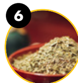
6 Erba mate (Ilex paraguariensis A. St.-Hil)