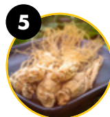
5 Ginseng coreano (Panax ginseng)