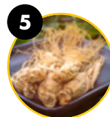
5 Ginseng coreano ( Panax ginseng )