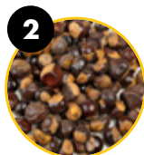
2 Guarana ( Paullinia cupana )