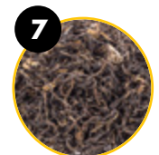
7 Grüntee-Blattextrakt ( Camellia sinensis )