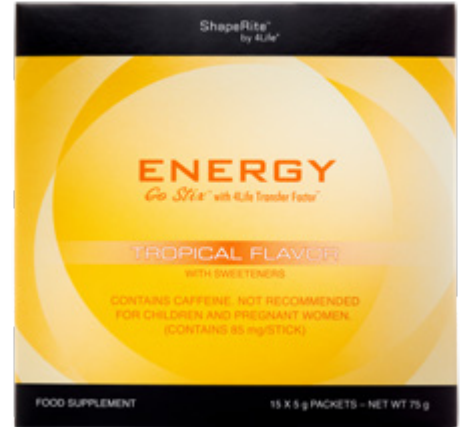
15 x 5 g-Päckchen Nettogewicht 75 g

Energy Go Stix Tropical ist ein Getränk mit Inhaltsstoffen, die unsere körperliche und geistige Energie steigern.