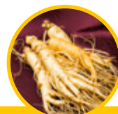
4. Raiz de ginseng ( Panax ginseng )

* Metabolismo é o nome dado às transformações químicas a que os nutrientes são submetidos nos tecidos após os processos digestivos e de absorção terem sido concluídos.