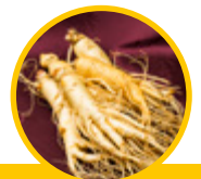
Korzeń żeń-szenia ( Panax ginseng )