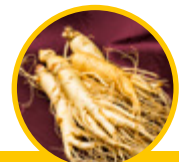
Racine de ginseng ( Panax ginseng )