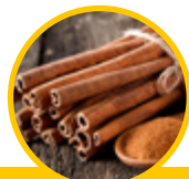
Écorce de cannelle ( Cinnamomum zeylanicum )

1,2,4 : Maintient les taux de sucre dans le sang (glucose)