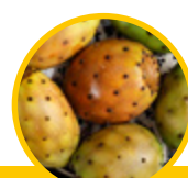
Nopal (figuier de Barbarie) ( Opuntia ficus-indica )