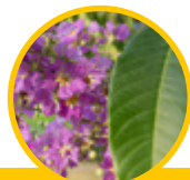
Feuille de bananier ( Lagerstroemia speciosa )