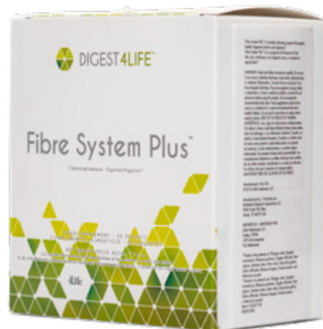
ПИЩЕВАЯ ДОБАВКА 30 ПАКЕТИКОВ МАССА НЕТТО: 114 г

Она содержит растительные ингредиенты, обеспечивающие здоровое и регулярное пищеварение.