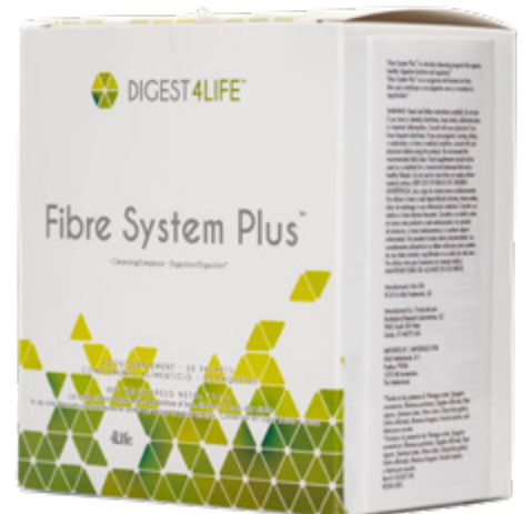
COMPLEMENTO ALIMENTICIO 30 PAQUETES • PESO NETO: 114 g

Contiene ingredientes de plantas que contribuyen a una adecuada digestión y a mantener la regularidad.