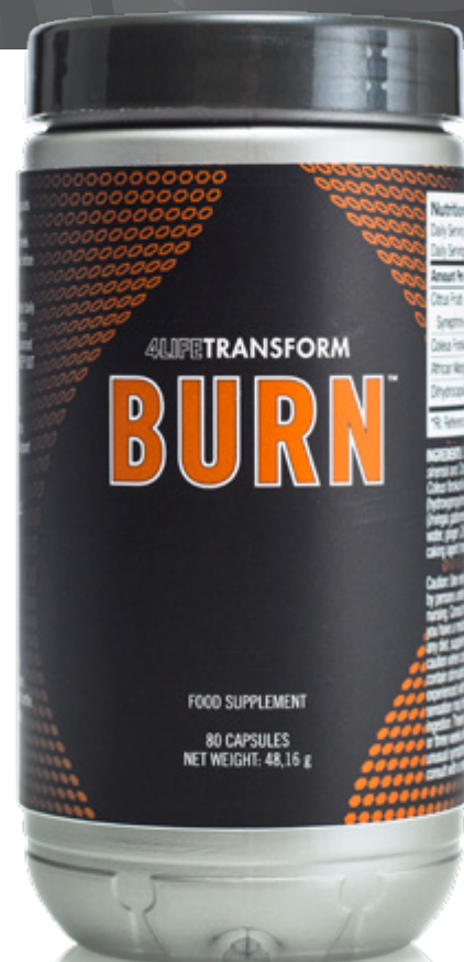
80 CÁPSULAS • PESO NETO: 48,16 g

MODO DE EMPLEO: Tomar dos (2) cápsulas diarias junto con 250 ml de líquido. Tomarlo al menos cinco días a la semana. Para mejores resultados tomar una hora antes del ejercicio.